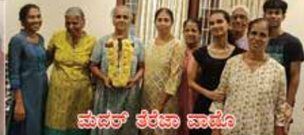
ಮಾದರ್ ತೆರೆಜಾ ವಾಡೊ