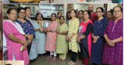
ಲೂದ್ ಪಯ್ಲೊ ವಾಡೊ