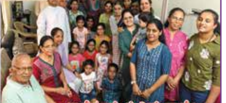
ಫಾಗೆವೆಂತ್ ಖೊರಿನ್ ವಾಡೊ