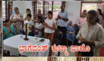
ಫಾಗೆವೆಂತ್ ಕುಟ್ಮಾ ವಾಡೊ