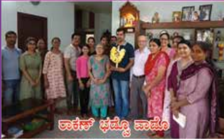
ಲಾಕರ್ ಭವ್ಯೊ ವಾಡೊ