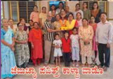
ಜೆಜುಚ್ಯಾ ಪವಿತ್ರ ಕಾಣ್ಣಾ ವಾಡೊ