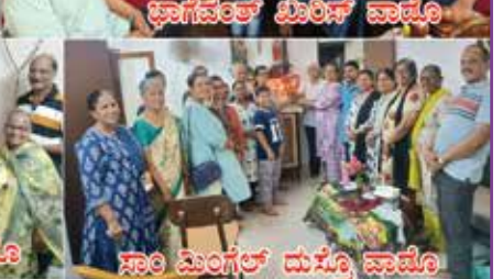
ಸಾಂ ಮಿಂಗಲ್ ಮಸ್ಕೊ ವಾಡೊ