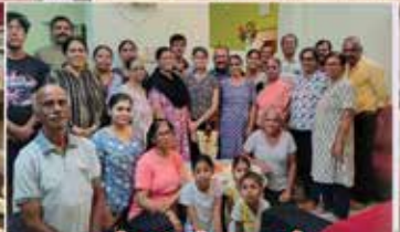
ಬಾಕ್ಲೆಕ್ ಜೆಜು ವಾಡೊ