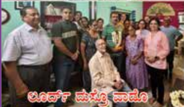
ಲೂದ್ ಪಯ್ಲೊ ವಾಡೊ