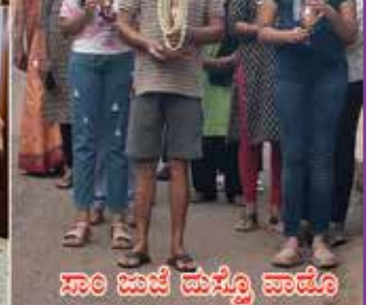
ಸಾಂ ಜುಜೆ ಮಸ್ಕೊ ವಾಡೊ